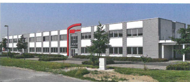
ASO Safety eröffnet in Lippstadt einen zweiten Standort in Deutschland.

nun wieder in seinen Heimatort Lippstadt. ASO Safety Solutions stellt heute Sicherheitssensoren, Steuerungen sowie Auswertelektronik für Märkte und Unternehmen auf allen fünf Kontinenten her. Dabei entfallen ca. 50 Prozent des Umsatzes auf den Tür- und Tormarkt, 40 Prozent auf den klassischen Maschinen- und Anlagenbau. Die restlichen zehn Prozent werden mit Märkten und Anwendungen realisiert, die auch Endverbrauchern ein Begriff sein dürften. So finden sich Sensoren von ASO sowohl in Disney-Vergnügungsparks als auch bei den Sendungen „Schlag den Raab“.